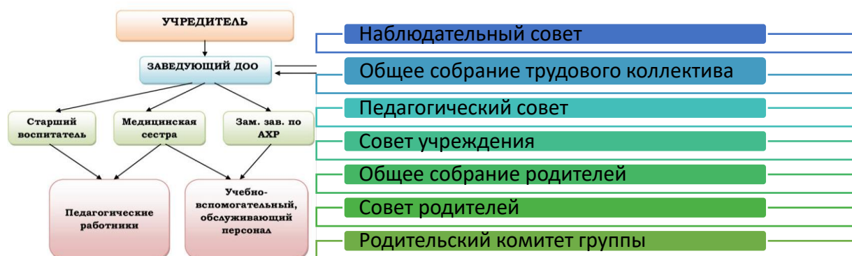
Рис 1. Модель структуры управления в МАДОУ № 18

Структура управления представлена двумя формами (рис.1): административным и коллегиальным.